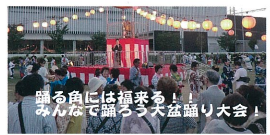
踊る角には福来る!! みんなで踊ろう大盆踊り大会!

～真夏のJazz & グルメフェスタ～ 日時 8月5日(土) (小雨決行・雨天中止) 12:00～21:00 場所 おどり公園(つくばエクスプレス三郷中央駅前) アクセス 電車/つくばエクスプレス三郷中央駅下車徒歩1分 ※駐車場はありません。 問い合わせ 「三郷市観光協会」事務局 商工観光課 ☎048-930-7721