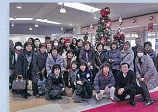
クルーズ前に皆さんで記念写真

な気温と晴天に恵まれ、参加された会員の皆様はとても喜んでいらつしゃいました。 サービス部会ではこのあと今年度最後の事業として3月22日の夜に「薬剤師は薬を飲まない」薬が病気を治すなどの著書をお招きしてストレス対処、メンタル強化がテーマのセミナーを開催予定です。 申込用紙は2月初旬の会報に同封予定です。皆さんふるってご参加下さい!!