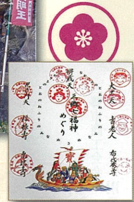
今年の七福神巡りです。弁財天が4ヶ所もありました!