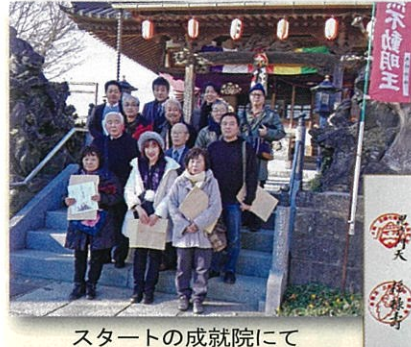
スタートの成就院にて