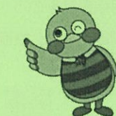
埼玉県マスコット「さいたまっち」

URL http://www.pref.saitama.lg.jp/a0808/rodoseminar/index.html