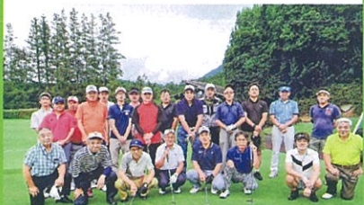
三郷市商工会建設部会 ゴルフ大会 令和元年7月24日(水) 宇都宮市レイクランドC・C

親睦ゴルフ大会をレイクランド市(カントリークラブ)で開催しました。参加者は23名で、貸切バスでの移動のため、車中の行き帰りや表彰式など終始和やかな雰囲気の中、行われました。上位入賞者は左記のとおりです。