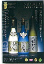
2020年冬 におどりチラン