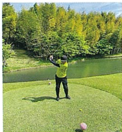
パー3でミスショット後、2打目をレディースティーから