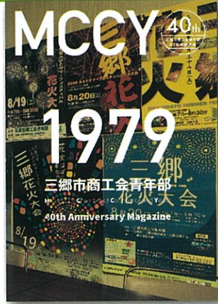
三郷市商工会青年部40周年記念誌の表紙