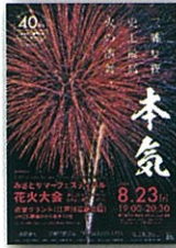
みまてサマーフェスティバル 花火大会ポスター(2019年)