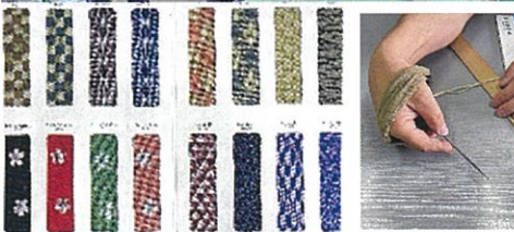
※畳の縁の種類も数多く取り揃えております。