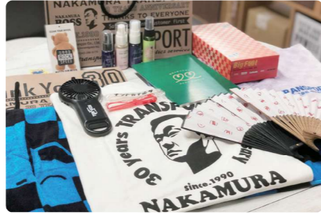
▲ノベルティ・記念品・周年誌、他