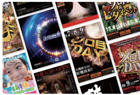
▲チラシ・パンフレット・ポストカード、他

SEECOM design studio 埼玉県三郷市三郷1-5-8 三光ビル302 TEL.048-934-5148 有限会社シーコム E-mail adseecom@waltz.ocn.ne.jp https://www.adseecom.com