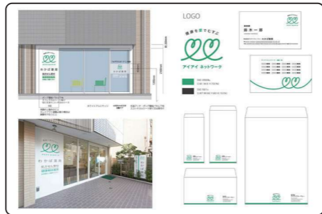
▲看板・ロゴ・封筒・幕、他