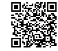
シーコム制作実績